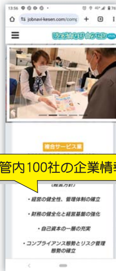
管内100社の企業情報