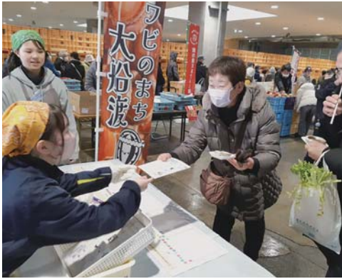
▲おふるまい希望者には商品レシピを配布