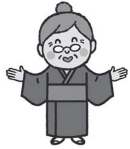
自殺対策キャラクター アイバあちゃん

人間関係や経済面・健康面など、不安やストレスを抱えながらの生活、さらに近年はコロナウイルス感染症や物価高騰など、社会情勢の変化による健康や生活への影響が懸念されています。こうした不安や悩みなどにより、心理的に追い詰められないよう、県民一人ひとりが自殺対策を身近な問題として受け止め、誰もが生きがいや希望をもって暮らすことのできる社会の実現を目指していくことが必要です。