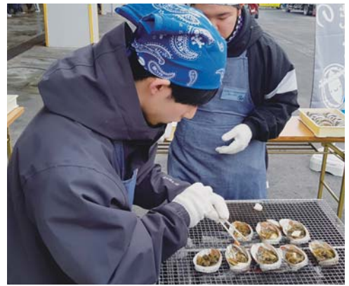
▲としるの貝がら焼きは60食分をおふるまい