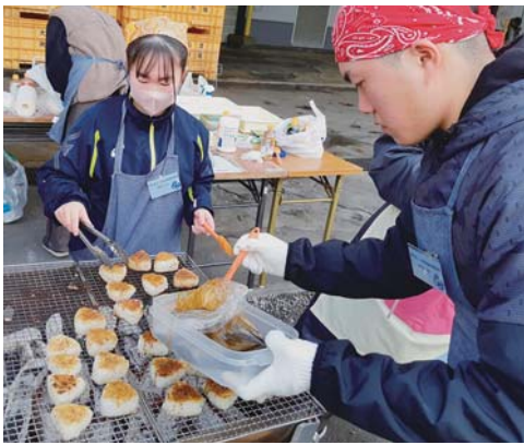
▲としる醤油の焼きおにぎりは炭火で焼いて提供

大船渡市魚市場を会場に開催された「第10回おふるまと産直海鮮まつり」において、東高校食物文化科3年「食のchallengeコース」の生徒4名が「としるの貝がら焼き」、「としる醤油の焼きおにぎり」のおふるまいを実施しました。 また、アワビ加工業者3社（元正榮北日本水産㈱、旬田村蓄養場、㈱野村海産）の販売コーナーでは、地元産活アワビや加工商品が普段より安い価格で販売される等、地域資源の蝦夷アワビを市内外の方々に広く周知PRする絶好の機会となりました。