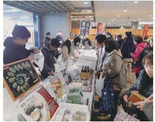
▲「アワビのまち大船渡ブース」にはアワビ加工業者3社の商品を展示販売

大船渡市魚市場を会場に開催された「第10回おふるまと産直海鮮まつり」において、東高校食物文化科3年「食のchallengeコース」の生徒4名が「としるの貝がら焼き」、「としる醤油の焼きおにぎり」のおふるまいを実施しました。 また、アワビ加工業者3社（元正榮北日本水産㈱、旬田村蓄養場、㈱野村海産）の販売コーナーでは、地元産活アワビや加工商品が普段より安い価格で販売される等、地域資源の蝦夷アワビを市内外の方々に広く周知PRする絶好の機会となりました。