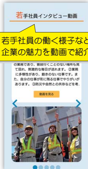
若手社員インタビュー動画