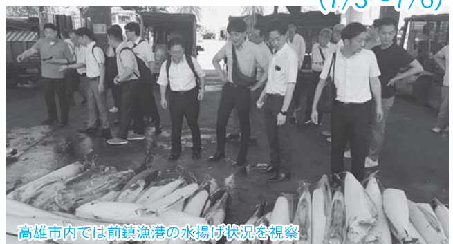
高雄市内では前鎮漁港の水揚げ状況を視察