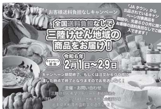
▲JAタウン出品サポート事業