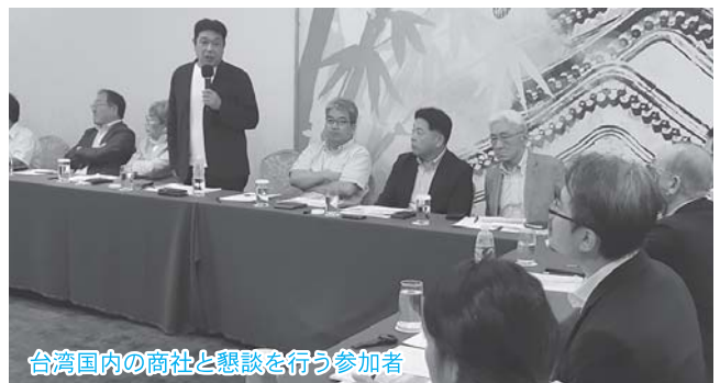
台湾国内の商社と懇談を行う参加者