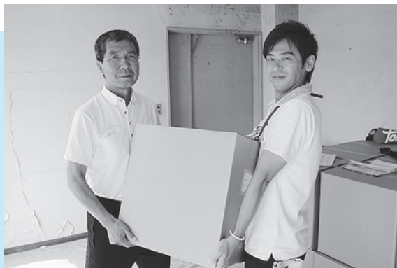
▲1台ずつ梱包されたパソコンが提供されました