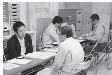
▲専門の相談員が一堂に会するワンストップ相談会