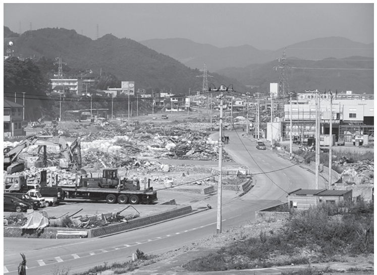
▲復旧・復興に向け、がれき処理が進む大船渡市内