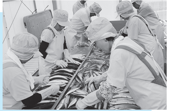
▶ 新しい作業場にて梱包作業が行われています