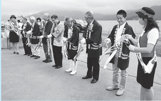
▶ 関係者によるテープカット

9月5日(月)、大船渡水産物商業協同組合で平成23年度大船渡港さんま直送便出発式が行われました。さんま直送便のお問い合わせ、お申し込みは大船渡市観光物産協会「大船渡港さんま直送便」事務局まで。☎0192-21-1922(平日午前8時~午後5時まで)