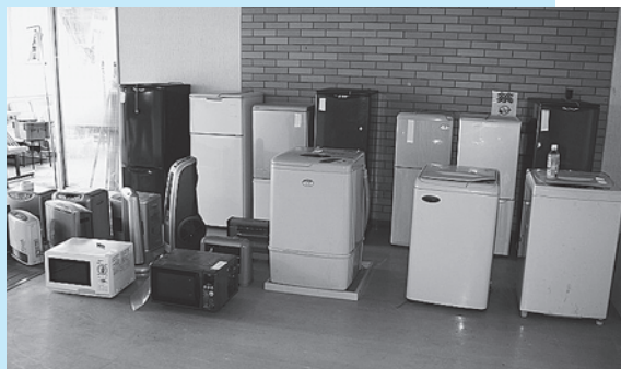
▲工具類の他に冷蔵庫・洗濯機なども