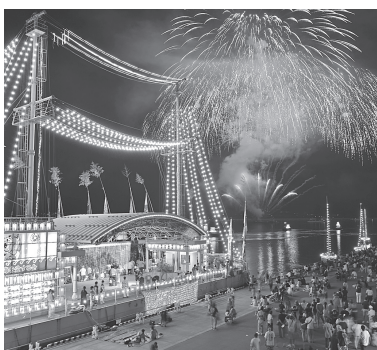
▲ 三陸・大船渡 夏まつり