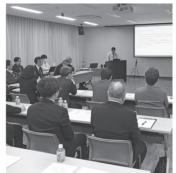
▲ DX人材育成プログラム