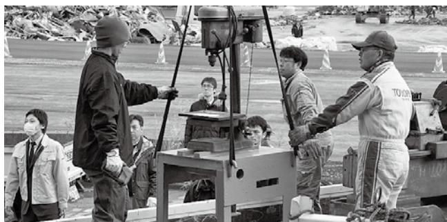
約30点の大型機械等が引き渡された

12月22日、大船渡商工会議所会館駐車場にて遊休機械マッチングプロジェクト贈呈式が行われました。同事業は震災で機械等を流失・破壊した事業者の復興支援を図るため、全国各地の事業者から遊休機械等を無償で提供をいただき、被災事業者の要望とのマッチングを行う支援事業です。今回、第一弾分の機械が確保でき7事業所約30点の機械の贈呈が行われました。日本商工会議所と東北6県会議所連合会、仙台商工会議所が中心となっておこなれる同事業は今後も被災事業者の要望に合わせた支援を継続します。同事業の詳細は5ページの記事をご覧ください。