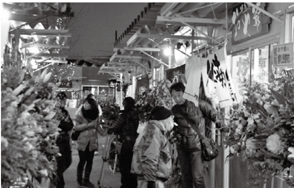
▲大船渡町野々田の復興屋台村

(※1) 雇用人数は、助成金請求時に雇用保険・健康保険共に加入している雇用人数で確定します。