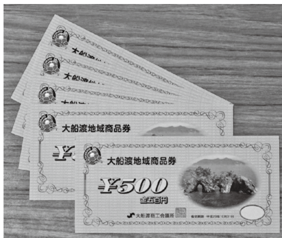
▲ 市内加盟店でご利用できる大船渡地域商品券