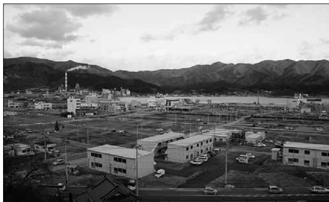
▲瓦礫撤去が進みオープンした仮設飲食店街

なって1つの地域の観光のPRに取り組む「destinationキャンペーン」が岩手県で行われます。市内への誘客を増やすチャンスとも言えるこのdestinationキャンペーンには、当地域でも積極的に取り組むことによって、大船渡の復興への足掛かりとなることは間違いございません。