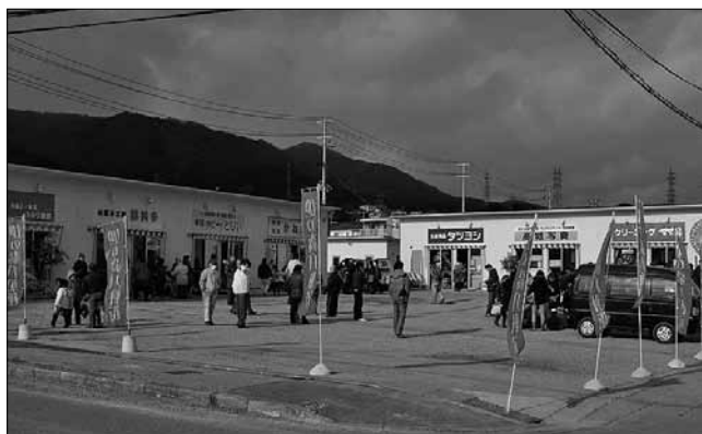
▲大船渡地の森に新設した地の森八軒街

今年を復興元年と位置づけ、大船渡商工会議所役員は一致団結し、中小企業や地域社会が抱えるさまざまな諸問題に応え、迅速かつ適切な対応に尽力するとともに、地域の総合経済団体としての使命遂行に真摯に努めてまいり所存でございます。がんばろう大船渡、ふるさととは負けない、災い転じて福となすの精神で、元気な大船渡にするために、会員の皆様の思いを受け止め、地域経済の復興・復旧に一丸となって前進してまいりますので、会員の皆様方の尚一層のご支援、ご協力を賜りますようお願い申し上げます。