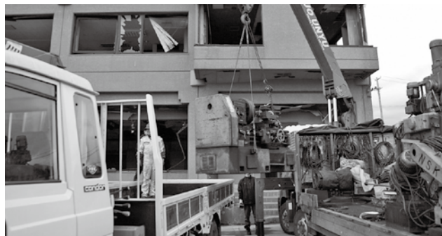
▲ 12月に行われた引渡し式の様子

③マッチング成立後、機械の受け渡しを行います。 (輸送の手配は、原則として商工会議所で行い、費用も負担しますが、機械の受け渡し後に発生する費用がある場合は各自でご負担いただきます)