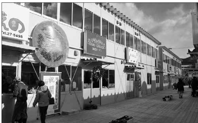
▲12月にオープンしたおおふなと夢商店街

震災の影響は人口の減少にも及び、震災前と比較すると約1,500人減少し、ついに4万人を下回りました。人口の増加は、復興には必要不可欠な条件であり、喫緊の課題であります。