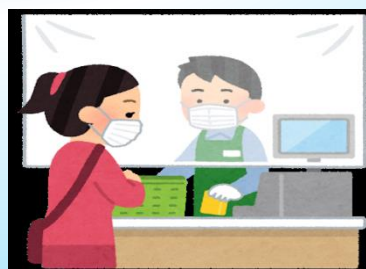
ビニール カーテン