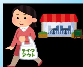
テイクアウト メニュー表作成