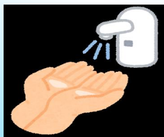
センサー式の 水道蛇口